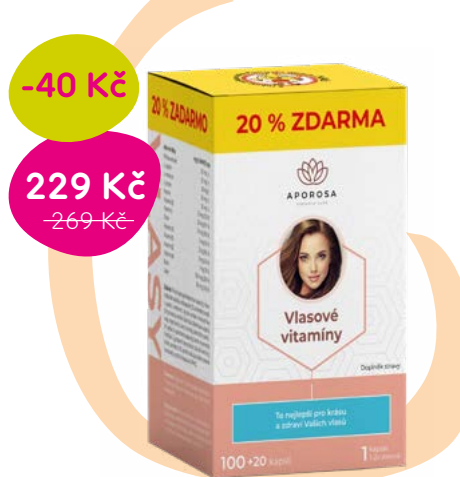
Doplňek stravy, 1,90 Kč/tbl.

Vyvážená směs vitamínů, minerálních látek, stopových prvků, aminokyselin, v kombinaci s extraktem z kopřivy a křemíkem.