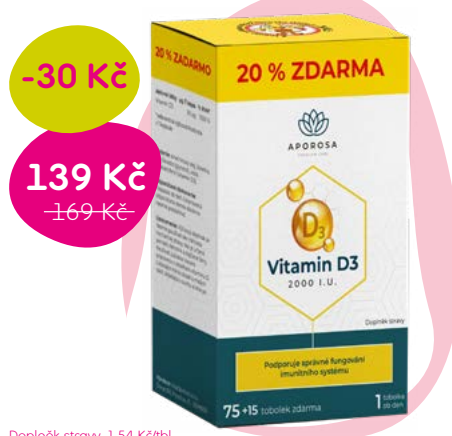
Doplňek stravy, 1,54 Kč/tbl.

Vitamin D3 podporuje správné fungování imunitního systému. Přispívá k udržení normálního stavu kostí a zubů, napomáhá k udržení normální činnosti svalů.