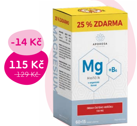
Doplňek stravy, 1,53 Kč/tbl.

Hořčík v organické formě citrátu hořečnatého se v lidském těle velmi dobře vstřebává. Hořčík s vitamínem B6 přispívají k normální činnosti nervové soustavy, k udržení normální psychické činnosti a podporují snížení míry únavy a vyčerpání.