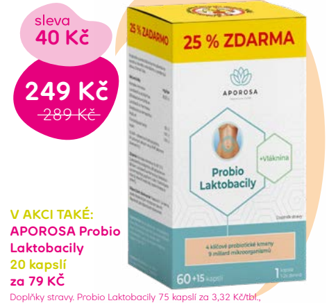
Doplňky stravy, Probio Laktobacily 75 kapslí za 3,32 Kč/tbl., 20 kapslí 3,95 Kč/tbl.

Komplex mikroorganismů s vlákninou příznivě působí na kondici střevního mikrobiomu a podporuje normální činnost střev.