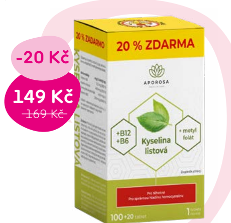
Doplňek stravy, 1,24 Kč/tbl.

Kyselina listová patří mezi vitamíny ze skupiny B (někdy se taky označuje jako vitamín B9 nebo folát). Společně s vitamínem B12 se podílí na tvorbě DNA, taky na dělení buněk v těle, tvorbě krve a růstových procesech.