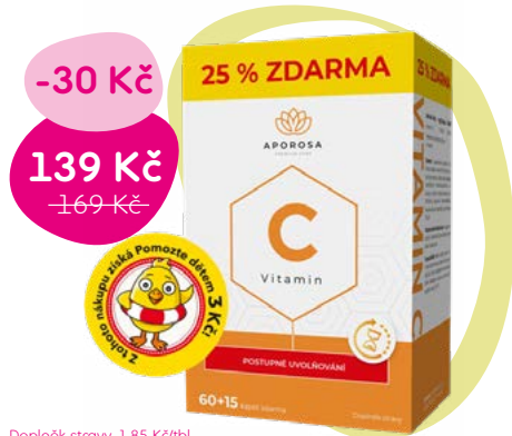
Doplňek stravy, 1,85 Kč/tbl.

Doplňek stravy s postupným uvolňováním. Vitamin C přispívá k normální funkci imunitního a nervového systému a ke snížení míry únavy a vyčerpání.