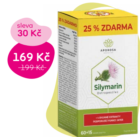
Doplňek stravy, 2,25 Kč/tbl.

Produkt přispívá k normální funkci trávení, jater a k jejich pročištění, udržuje normální hladinu cukru v krvi, podporuje přirozenou obranyschopnost.